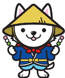
公式キャラクター 「いせわんこ」