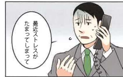
忙しくて時間が取れない時