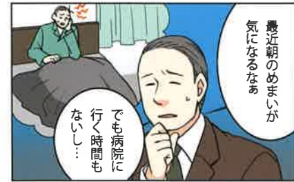
気になる身体の不調時