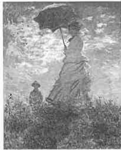
作品名〔散歩、日傘をさす女〕 作者名〔クロード・モネ 1840～1926〕