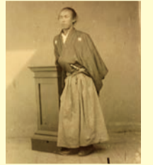
坂本龍馬肖像

福山市西町2-4-1 TEL 084(931)2513 ●開館時間/9:00～17:00(入館は16:30まで) ●休館日/月曜(ただし7/17は開館) ●入館料/一般700円、高校・大学生520円、小・中学生350円