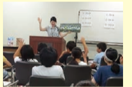
ブックトーク昨年度の様子

広島市中区千田町3-7-47 広島県情報プラザ内 TEL 082(241)4995 ●開館時間/火曜～金曜9:30～19:00、土・日曜9:30～17:00 ●休館日/月曜・祝日