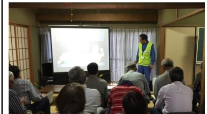
あきつほっと安心ネットワーク防災チーム研修会