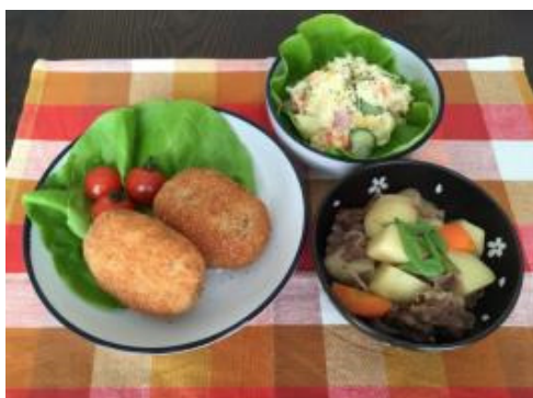
家庭でよく作られるじゃがいも料理例