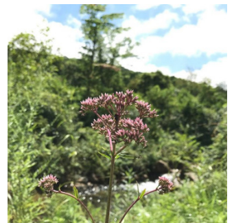
#霧ヶ谷25 #サワヒヨドリ