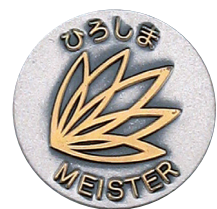
マイスター章(き章)

マイスター章のデザインは、広島県の花・木である「もみじ」と卓越した技能者の手をイメージし、ひろしまマイスターの活躍を通じて技能尊重社会への発展と輝ける未来への希望を表しています。