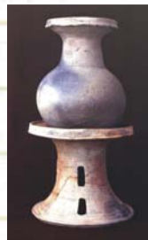
弥生土器（岡山県上東遺跡出土品・複製）