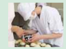
広島北特別支援学校での作業学習「食品加工」の様子