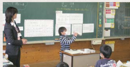
算数の授業では、例えば図や具体物などを用いて、自分の考えを説明する授業が展開されます

子どもたちの思考力・判断力・表現力などをはぐくむため、すべての教科等の授業で、言語活動の充実を図ります。広島県では、平成15年度から全国に先駆けて展開している「ことばの教育」の取り組みを生かし、各学校の授業改善を一層推進していきます。