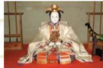
五月人形（豊太閤）竹原・春風館蔵