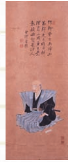
頼杏坪肖像画(個人蔵)

▲入館料/一般:500円、高校生・大学生:380円、小・中学生:250円 ●期間/4月23日(金)～6月13日(日)まで ●内容/江戸時代後期、儒学者として活躍するかたわら、代官としても備後北部の民政に尽くした頼杏坪の業績と、当時の生活や文化を紹介します。