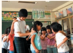
▲3年生は母校の小学校の「リトルティーチャー」となって、後輩たちに教えます

1年生は高校訪問や企業訪問、2年生は大学探検や職場体験、3年生はリトルティーチャー(小学校での指導)や地域ボランティア、英会話チャレンジ(外国人への話しかけ)などの活動を通して、自分の将来を見つめます。