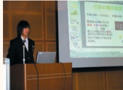
▲3年生は三次市の未来展望を中心としたテーマで個人で研究し発表します

課題の見出し方や研究の進め方などを基礎講座で学んだ上で、三次の自然や社会についての探究学習を行います。一斉活動日には地域に出て情報収集を行い、最後には学年ごとの発表会を開催。優秀な研究は全校発表会で、市への提言として発表します。