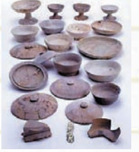
西本6号遺跡(7世紀後半の神社跡)の出土品—杯・甕・馬具—

▲入館料/一般:700円、高校生・大学生:520円、小・中学生:350円 ●期間/4月23日(金)～6月13日(日)まで ●内容/古墳時代から奈良時代にかけて成立した安芸国と備後国の、当時の政治、地域の特徴などを、発掘調査の成果を中心に紹介します。