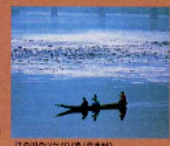
江の川の夕景(佐木村)

入館料 一般/400円(団体320円) 高校・大学生/300円(団体240円) 小・中学生/200円(団体160円)