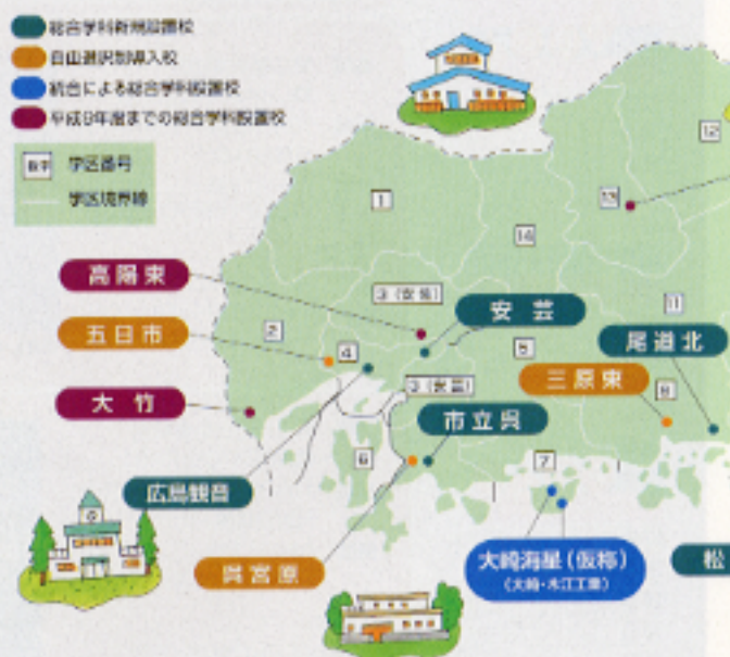
総合学科設置校及び自由選択制導入校配置図