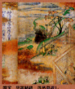
国宝 平家納経 夢見庵

第49回広島県美術館 9月9日(火)~9月28日(日) 平家納経と飯島の宝物 10月14日(火)~11月24日(月) 生涯100年記念特別展 12月5日(金)~1月15日(木)