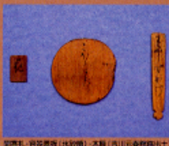
陶器・骨角器類(秋の物)・木製(古川町遺跡出土)

入館料 一般/700円(団体560円) 高校・大学生/520円(団体410円) 小・中学生/350円(団体280円)