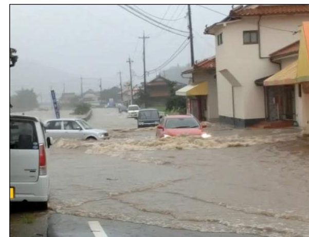
へいせい ねん がつ 平成26年8月 川のはんらん [三原市]

大雨によって川などがあふれることでおこる災害です。ていぼうをこえた水がながれこみ、家や田畑などが水につかります。