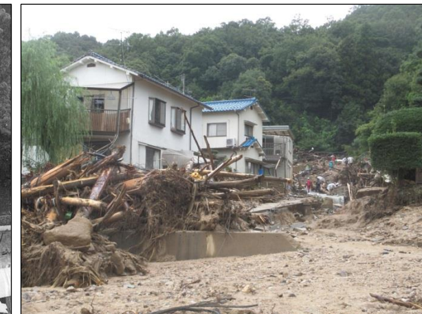
へいせい ねん がつ ししゃ めい 平成26年8月（死者77名） 土石流 [広島市]