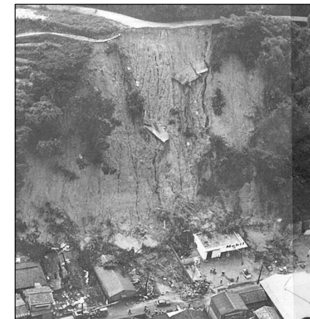
しょうわ ねん がつ ししゃ めい 昭和42年7月（死者159名） がけくずれ [呉市]

大雨などにより、山やがけがくずれ、たくさんのどろや木、大きな岩がながれてくることでおこる災害です。 家や田畑や道路をこわし、人のいのちまでうばってしまうことがあります。「土石流」「がけくずれ」「地すべり」などがあります。