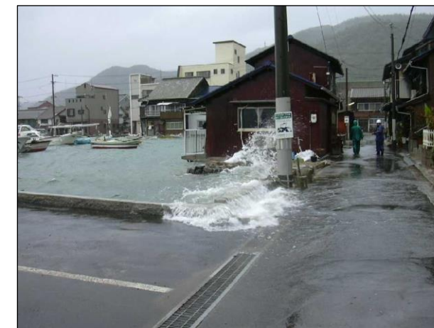
へいせい ねん がつ 平成16年9月 台風18号による高潮 [三原市]

海面が高くなり、海水がながれこむことでおこる災害です。道路や家などが海水につかります。