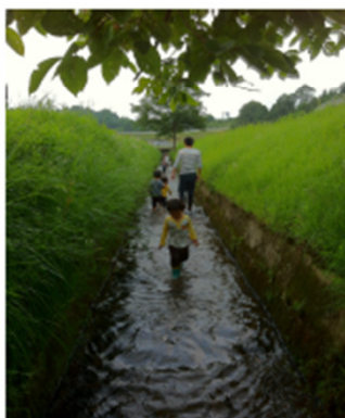
沢の池の用水路を楽しむ