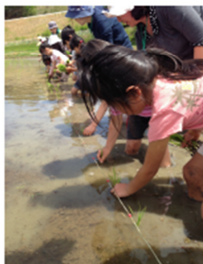
農家に種まきを教わることも