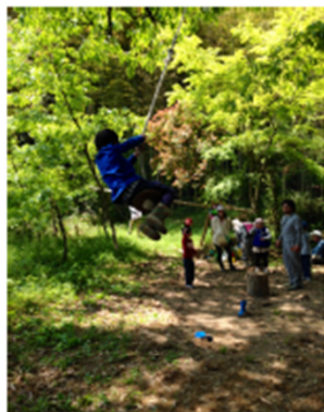
あべまきの丘から鳥スパンのブランコを楽しむ

インタープリター (自然解説者) と一緒に園周辺の里山を探検します。ルートが三つあるので、それぞれ違う楽しい体験をしています。一歩履くと、春と秋に行き、いろいろな発見をしています。