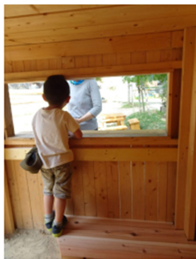
窓越しに話しかける