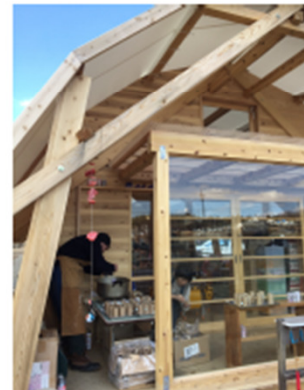
卒園キャンドルをつくる