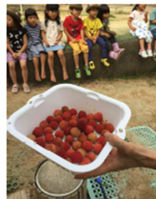
園庭のヤマモモの実をとる