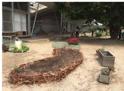
園庭に野菜畑をつくる