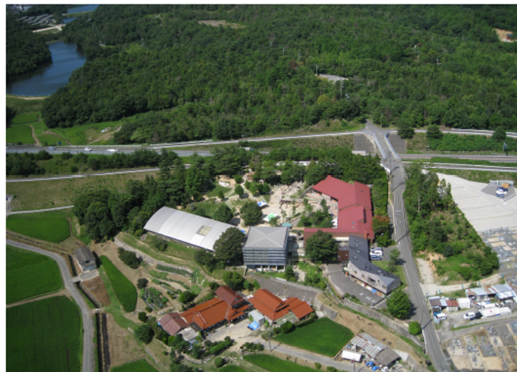
さざなみの森の全景と周辺環境（手前には農家と田んぼあり）