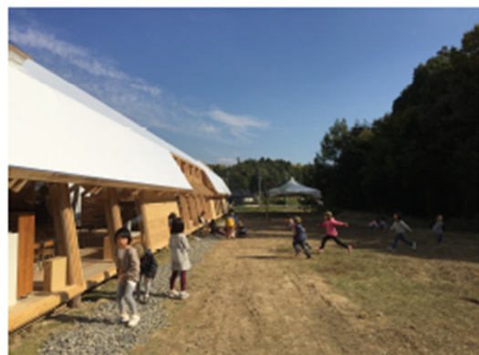
第二園庭のはらっぱで遊ぶ