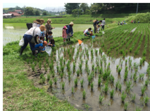
みんなのカエルをみんなで探す