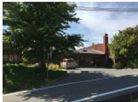
メインエントランス