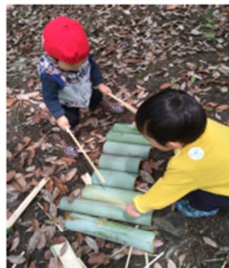
竹の切り場で竹藪あそび