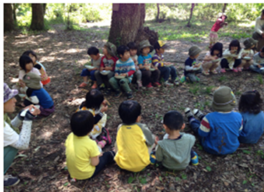
大きなあべまきの木でくつろぐ