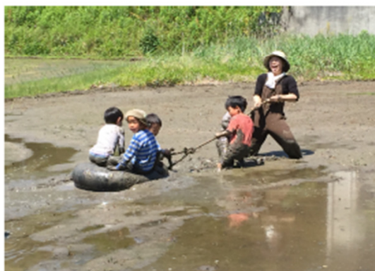
みんなドロドロの泥遊び