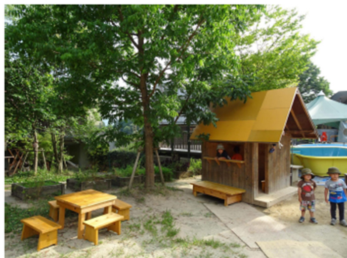
園庭に小屋とテーブル&イスをつくる

秋から風の棟（第25年）と響の棟（第18年）の改修工事が始まります。工事期間中、5歳児の子どもたちは第二園庭（はらっぱ）の仮設園舎で過ごします。それを契機に、里山を駆けめぐり、また自然の神秘を体感できるような活動を深めていこうと考えています。火のある暮らしやこの時、この場所だから経験できる、機会づくり、場づくりを計画します。