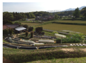
休農舎から見る農家と田