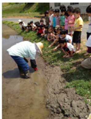
農家の方に種まきの方法を教わる