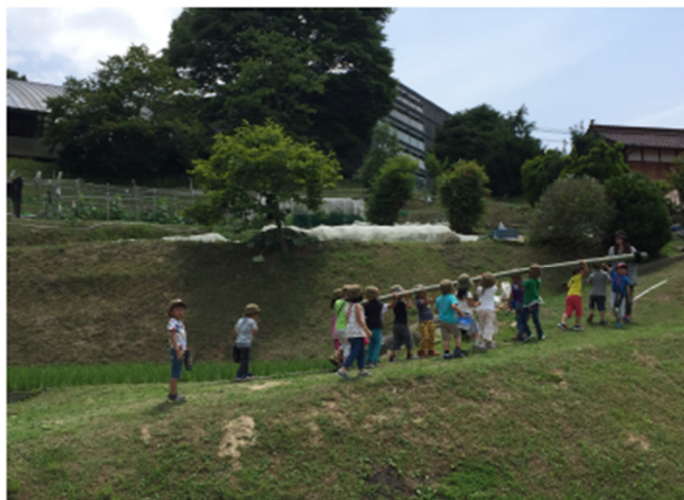
竹を切り出し、重たいけど、みんなで重ぶとんとか持った