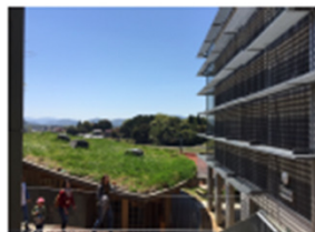
草屋根の吹の棟と響の棟