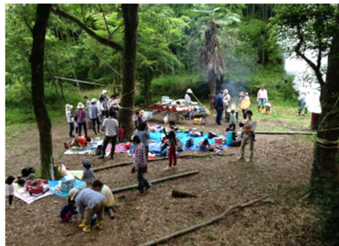
月一回の親子のあべまき広場活動、みんなそれぞれ楽しんでる