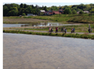
田んぼのあぜ道を散歩する