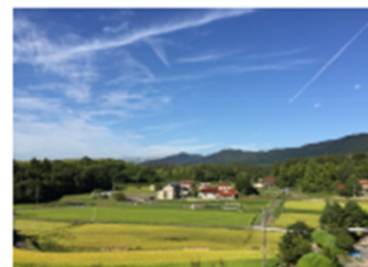
農舎からみればの風景