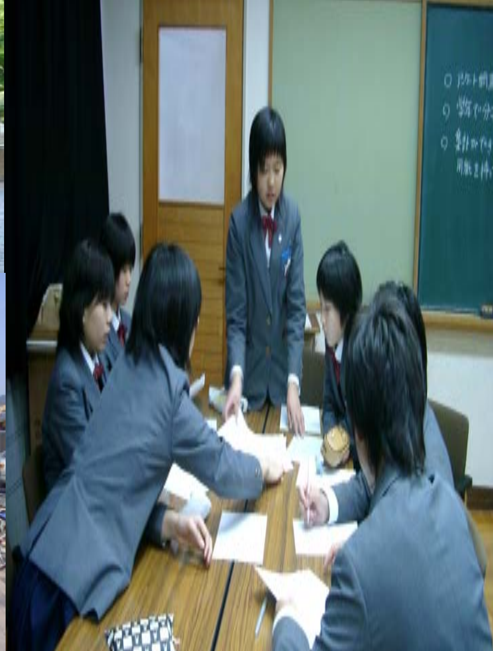
地域の方へのアンケート調査と集計の様子