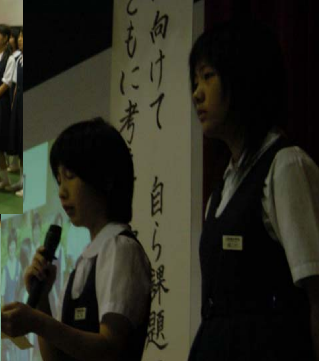
県大会・アトラクションでの道徳系の発表の様子