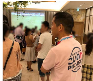
コラボ企画第 1 弾！広島初登場の「走らないサッカー」ウォーキングサッカーを取り入れたアクティビティイベント