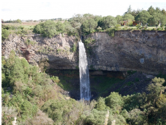
👉 遠くから見ても圧巻。

さて先日、友人とその大家さん家族と一緒にメキシコシティを抜け、イダルゴ州というところに滝を見に行きまわりました。Prismas Basálticos という自然保護公園なのですが、ここでは壮大な滝を近くで見ることができます。