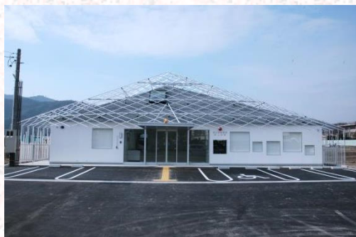
福山東警察署野上交番 (平成28年2月完成)