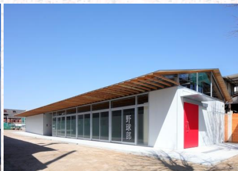
広島工業高等学校部室 (平成30年2月完成)