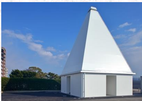
御幸松広場トイレ (平成29年2月完成)