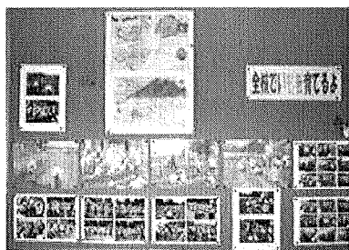
道徳的な学習情報の掲示

学校や学級内の人間関係や環境は、様々な側面から児童生徒の道徳性の発達に影響を与えるものであることを踏まえ、それらを整えるとともに、学校における道徳教育の指導内容が児童生徒の日常生活に生かされ、人間としての生き方についての自覚を深めることができるよう配慮することが大切である。