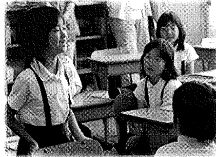
児童生徒の心の動きを予想して

児童生徒がどのような問題意識をもって学習に臨み、ねらいとする道徳的価値を追求し、多様な感じ方や考え方によって学び合うことができるかを具体的に予想しながら、それが効果的になされるための発問を吟味したり、授業の全体の展開を構想したりする。