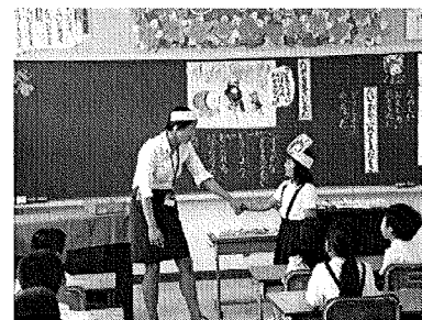
役割演技を取り入れた表現活動の工夫

言葉は、知的活動だけでなく、コミュニケーションや感性、情緒の基盤であり、学校の教育活動全体で言葉を生かした教育の充実が求められている。道徳の時間においても、その言葉を生かした教育についての充実が図られなければならない。