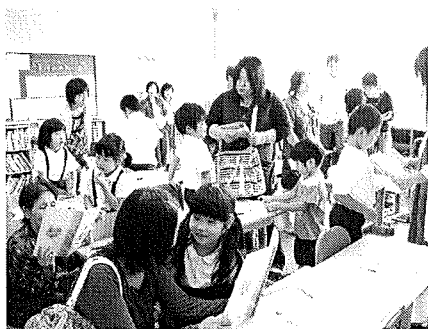
保護者の参加による道徳授業