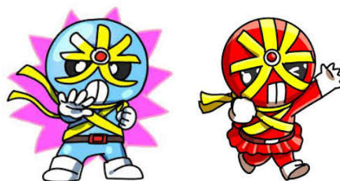
反射材活用促進キャラクター（広島県警）