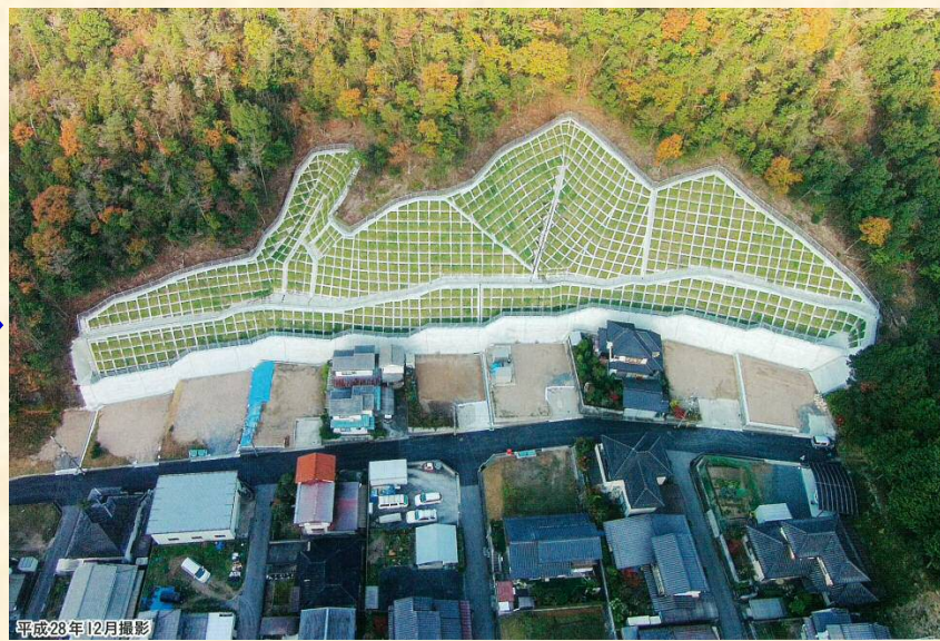
H26年 広島土砂災害での事業例