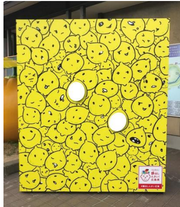
漫画家・西島大介氏描き下ろし レモンちゃんパネル 尾道市 瀬戸田町観光案内所に設置。