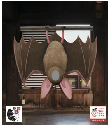
逆さまコウモリパネル 福山市 福山城博物館に設置。