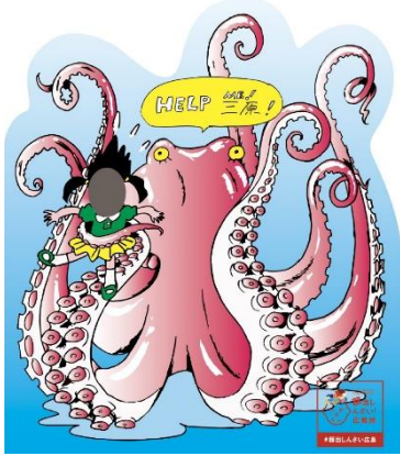
三原やっさタコ。マンガ家タナカカツキ氏描き下ろし顔出しパネル！ 三原市 道の駅みはら神明の里に設置。