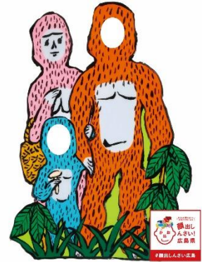
謎の猿人類ヒバゴン！ 顔出しパネル 庄原市 国営備北丘陵公園内に設置。