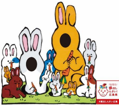
“うさぎ”なりきりパネル 竹原市 たけはら海の駅に設置。