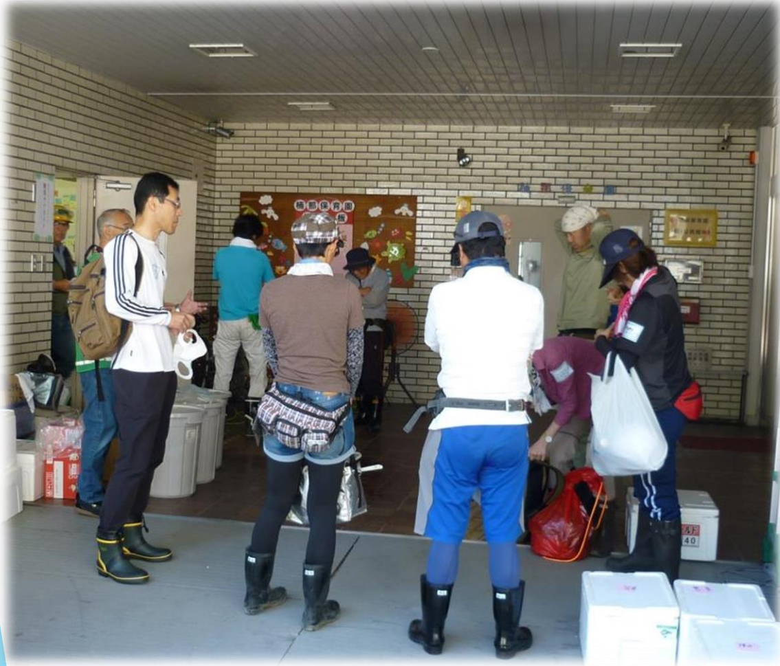
〈楠那公民館に集まった災害ボランティア〉