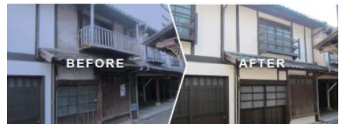
<伝統的建造物の保存修理の例>