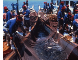
<鞆の浦鯛しばり網漁法>