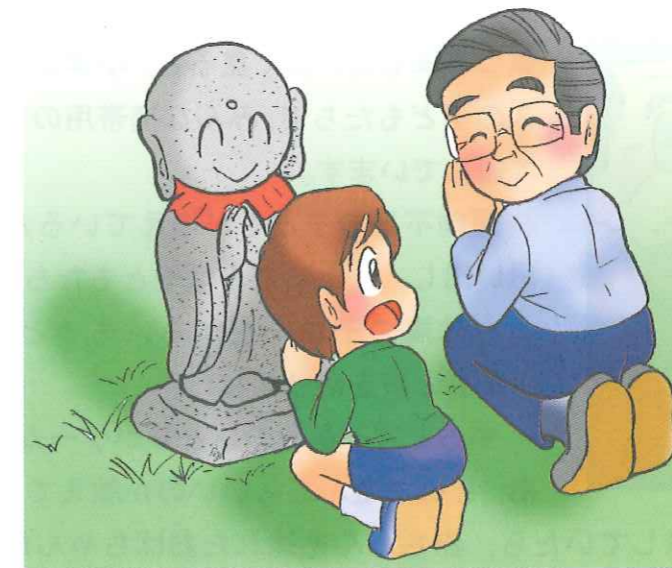
イラスト：うじな かずひこ

若い人たちが子育てをしている様子を見かけたとき、「ああ、私の子どもにもこんなころがあったよな」とか「いまどきの子育てって、どうなってるのかしら」などと感じたことはありませんか。