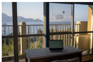
フウド内部(お試しオフィス)