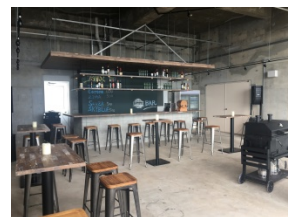
Uminosu内部 (江田島市沖美町是長 1433-2)