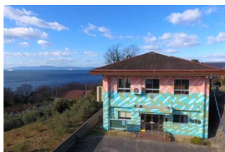
フウド[風・海・土] (江田島市沖美町畑 997-2)