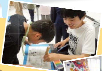
来客とのやり取りの仕方を学んで、行事の受付係を担当。

高等学校 県立世羅高等学校 地元の農産物を栽培、利用して新商品を開発したり、地域の特産品の人気復活を目指して研究を重ね、地域産業の活性化に取り組んでいます。