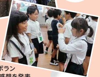
手話サークルのボランティアを体験し、感想を発表。

小学校 廿日市市立大野東小学校 市役所のシティブロモーション室や社会福祉協議会、地域ボランティアなどと協力して、「ふるさと廿日市」について探究的に学ぶ教育活動に取り組んでいます。