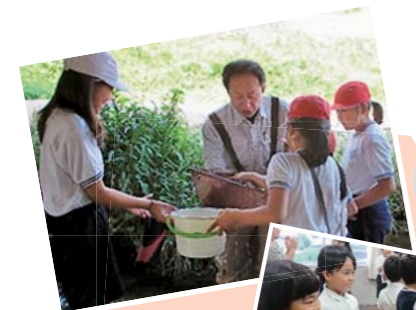
広島県水産研究所の方から廿日市の自然について学びました。