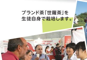
ブランド茶「世羅茶」を生徒自身で栽培します。