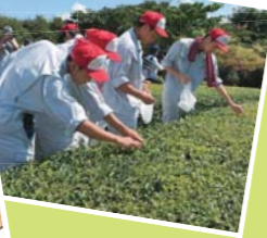
イタリアで開催された国際イベントで「世羅茶」を紹介しました。

高等学校 県立世羅高等学校 地元の農産物を栽培、利用して新商品を開発したり、地域の特産品の人気復活を目指して研究を重ね、地域産業の活性化に取り組んでいます。