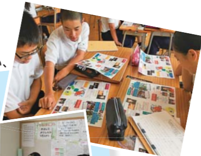
アイデアを出し合い、ふるさと庄原を発信するリーフレットを作成しました。

小学校 廿日市市立大野東小学校 市役所のシティブロモーション室や社会福祉協議会、地域ボランティアなどと協力して、「ふるさと廿日市」について探究的に学ぶ教育活動に取り組んでいます。