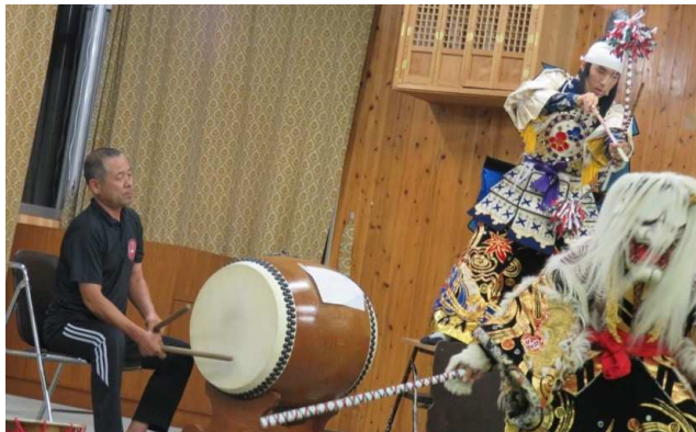
「地域の方から伝統芸能を学んでいる様子」

連携先:北広島町立芸北つし保育園、さつきヶ丘保育所、北広島町立芸北小学校、北広島町立芸北中学校、中央大学ビジネススクール、北広島町農山村体験推進協議会、北広島町役場、一般社団法人 芸北道場、認定NPO法人西中国山地自然史研究会