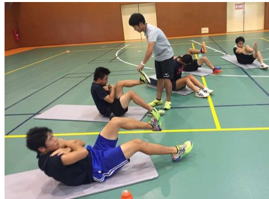
部活動支援「競技スキー」の様子