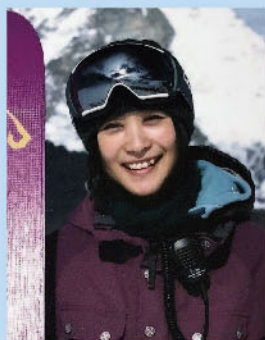
上村 愛子 coach

アルペンで培った技術をモーグルで活かすことができ、新しい道でチャンスが広がりました。新しい技術を覚えるのには、苦労がありますが、楽しそうと思えたらそれがチャンスなのだと思います!!