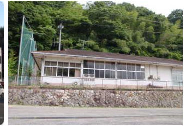
上戸野地域センター