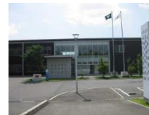
生涯学習支援センター（福富支所）