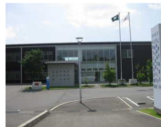
久芳地域センター