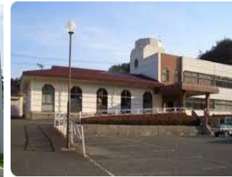
竹仁地域センター