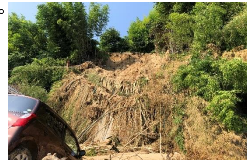
斜面崩壊・被災状況（H30年7月）