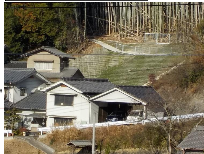
工事完了（令和2年1月20日）