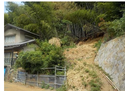
斜面崩壊・被災状況（H30年7月）