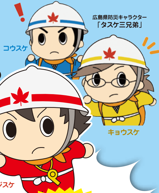
広島県防災キャラクター 「タスケ三兄弟」