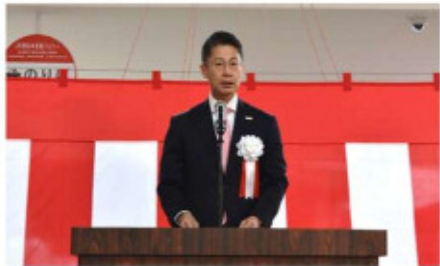
式辞 広島県知事 湯崎英彦