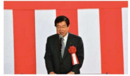
祝辞 衆議院議員 平口洋