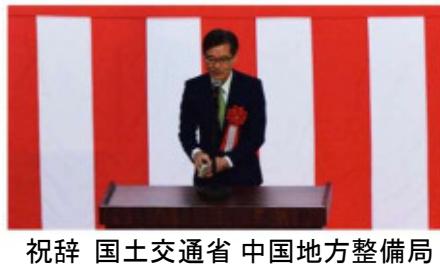
祝辞 国土交通省 中国地方整備局 副局長 富岡誠司