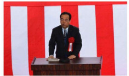
祝辞 広島県議会議長 中本隆志