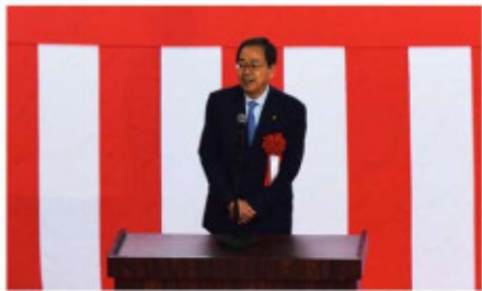
祝辞 衆議院議員 斉藤鉄夫