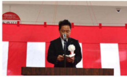
挨拶 廿日市市長 松本太郎