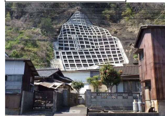
工事完了（令和2年3月27日）