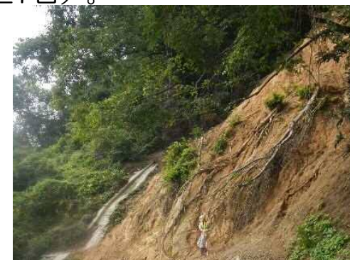
斜面崩壊・被災状況（H30年7月）