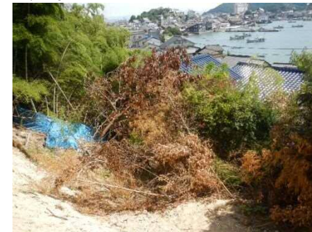
斜面崩壊・被災状況（H30年7月）