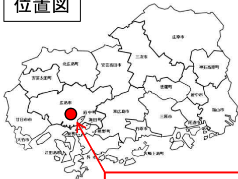
中山西一丁目地区