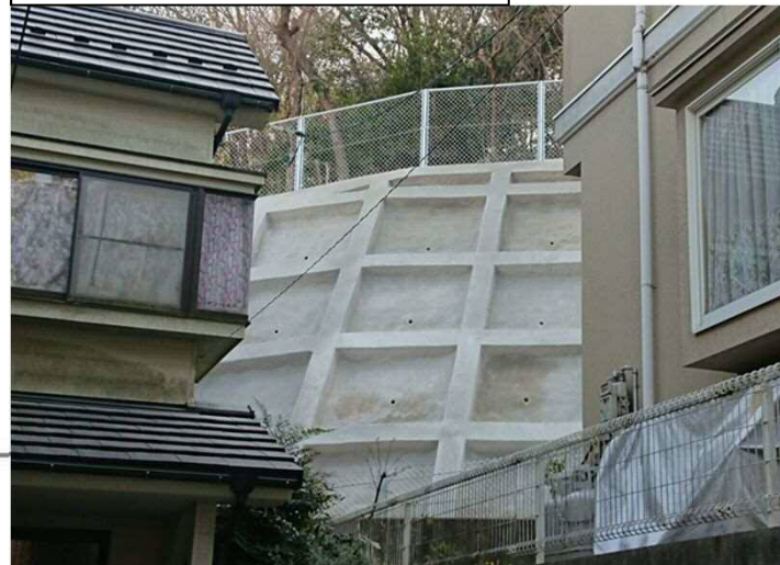
工事完了（令和2年3月27日）