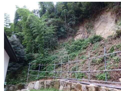
斜面崩壊・被災状況（H30年7月）

保全対象：人家2戸 主な対策：法枠工 約380m 2 事業費：約63,000千円