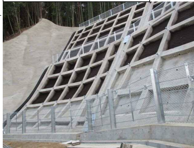
工事完了（令和2年3月27日）