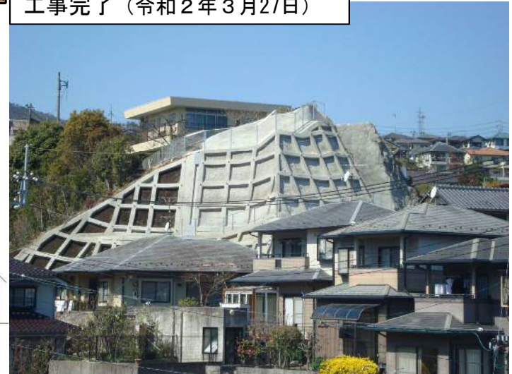
工事完了（令和2年3月27日）