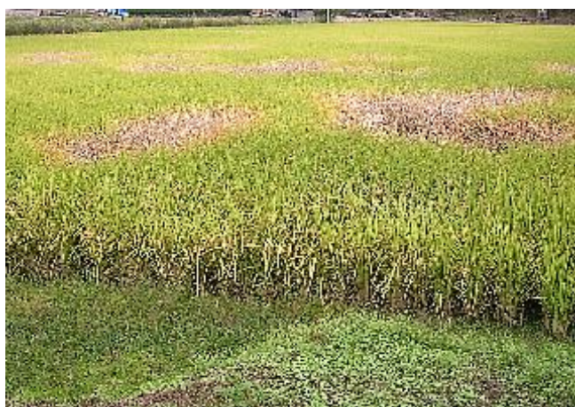
図1 トビイロウンカ長翅型成虫（左上）と短翅型雌成虫（右上）。「坪枯れ」被害（下）