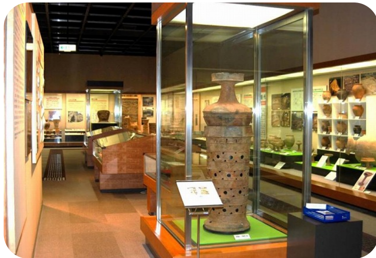
実物資料で歴史学習ができる常設展示室