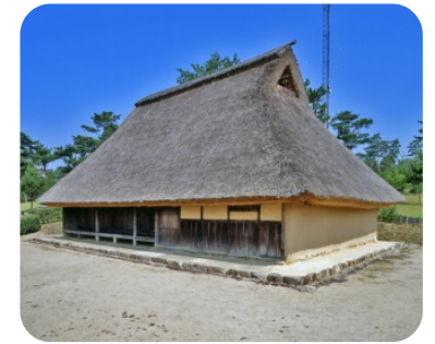
昔の暮らしが体感できる 旧真野家住宅（重要文化財）