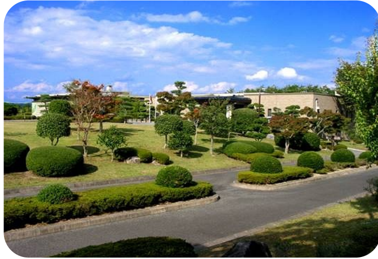
みよし風土記の丘ミュージアム