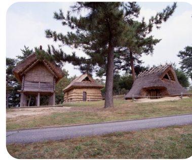
大昔の建物が体感できる 復原古代住居