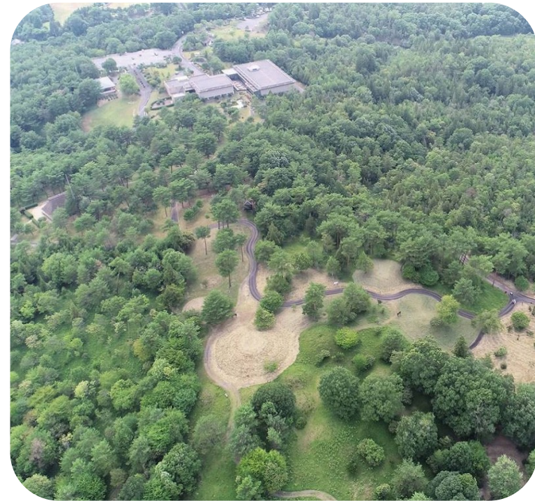
自然あふれる風土記の丘（手前は七ツ塚古墳群の一部）