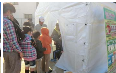
▲濃煙体験訓練（消防署指導）