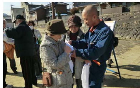
▲応急救護訓練（消防団指導）