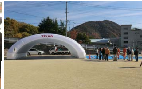
▲地元企業からの機材提供