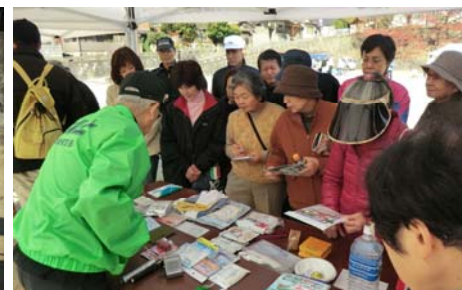
▲防災グッズの展示（防災士）