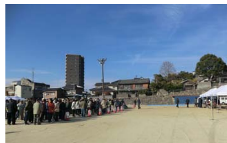
▲小学校への避難完了