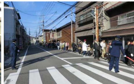
▲避難訓練（警察による交通整理）