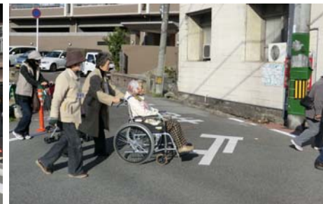
▲支援が必要な住民の避難訓練