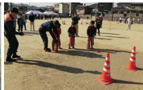
▲初期消火訓練（消防署指導）