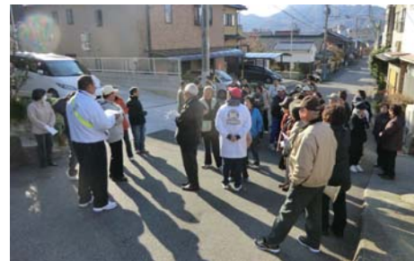
▲一時避難所への集合