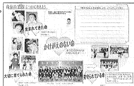
宮園小オリジナル「心のノート」

その一例として、廿日市市立宮園小学校が平成22年度からオリジナル版「心のノート」の作成に取り組んでいる。児童に道徳的価値をより自分とのかかわり度ととらえ、考えを深めさせる等、趣旨を考慮したものとして意義深い。