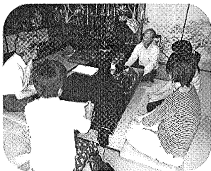
地域の方の協力を得ての教材開発