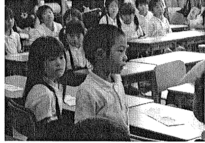
児童生徒の心の動きを予想して

児童生徒がどのような問題意識をもって学習に臨み、ねらいとする道徳的価値を追求し、多様な感じ方や考え方によって学び合うことができるかを具体的に予想しながら、それが効果的になされるための発問を吟味したり、授業の全体の展開を構想したりする。