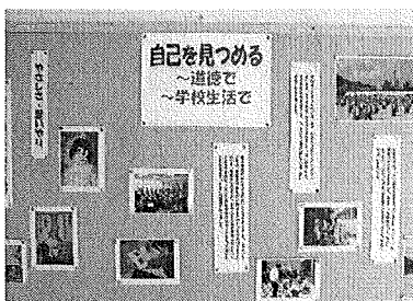
道徳的な学習情報の掲示

学校や学級内の人間関係や環境は、様々な側面から児童生徒の道徳性の発達に影響を与えるものであることを踏まえ、それらを整えるとともに、学校における道徳教育の指導内容が児童生徒の日常生活に生かされ、人間としての生き方についての自覚を深めることができるよう配慮することが大切である。