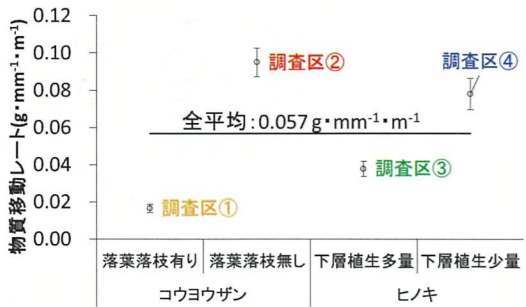
図1 各調査区の土砂移動量

較を行いました。同じ処理をヒノキ林で行うことは難しかったため、下層植生の多いところ③少ないところ④の条件を設定しました。 その結果が図1になります。縦軸の物質移動レートとは、幅1m当りの土砂流出量(g)を降雨量(mm)で割った値ですが、ここでは単純に土砂移動量と考えてください。この図からこの調査時点では、コウヨウザン林(調査区①)ではヒノキ林(調査区③④)よりも土砂移動量が非常に少ないことがわかります。また、コウヨウザン林の落葉落枝除去した箇所(調査区②)では、他の調査区(①③④)と比較して非常に土砂移動量が多い結