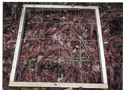
写真2 コウヨウザン林の林床 落葉が多く見られる

の違いにあります。それは、スギの葉は比較的分解しにくいのに対して、ヒノキの葉は分解しやすいという性質です。そのため、スギ林では落葉の層が雨滴から表土を守りますが、ヒノキ林では落葉の層を形成しにくいため守ることができず、スギ林よりヒノキ林の方が土砂移動