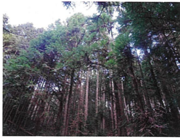
写真1 コウヨウザン林

今回は、まだ調査途中ではありますが、コウヨウザン人工林内の土砂移動量について、スギとヒノキの