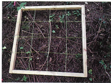
写真3 ヒノキ林の林床 落葉がほとんどなく、枝のみが見られる

量は多くなるのです。 それでは、コウヨウザン林では林床の有機物はどうなっているのでしょうか? 広島県庄原市の民有林にある樹齢50年程度のコウヨウザン林の林床を調査してみると、有機物が非常に厚く堆積している様子が見られました(写真2)。同時に調査した隣接するヒノキ林の林床(写真3)と比べると、その違いは一目瞭然かと思えます。このことからコウヨウザン林では土砂移動量は大きくないことが予想されましたので、実際に調べてみました。