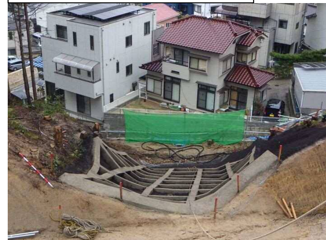
工事完了（令和2年3月30日）