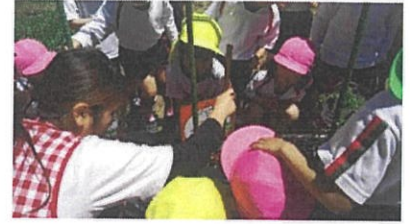
苗を植えて3日後、ちょっと背が高くなっているような…？みんなで測ってみよう！