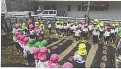
4月下旬、自分が育てたいトマトを選んで、トマトの苗を植えました。