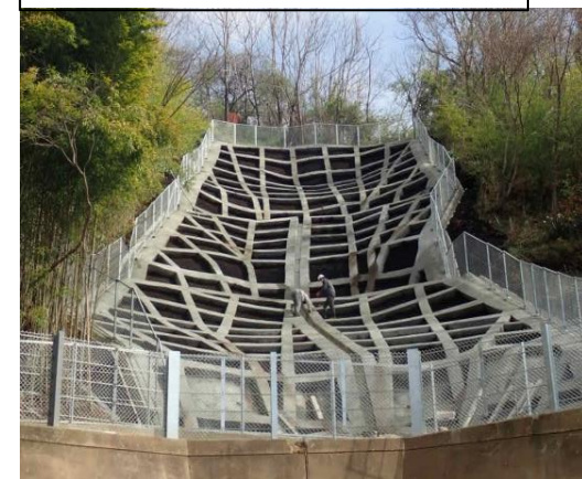
工事完了（令和2年3月19日）

設計：復建調査設計株式会社 施工：株式会社大竹山工業所 発注：西部建設事務所呉支所