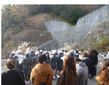
写真2 参観日での砂防出前講座（左）

※ 新型コロナウイルス感染症の感染拡大の対応として「砂防学習動画」の公開やweb会議システムを活用した講義など砂防学習の機会確保策を実施する。