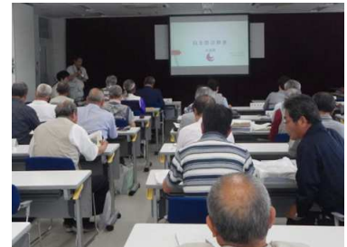
写真3 自主防災組織への防災教室