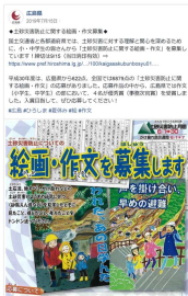
図1 絵画・作文広報(SNS)

エ 日頃から土砂災害リスクを意識できるよう小学校区ごとに土砂災害警戒区域等の標識を設置