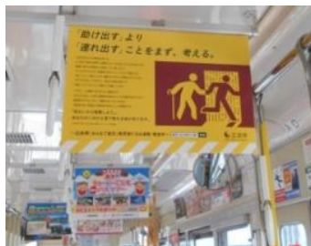
図2 啓発ポスター（広島電鉄）