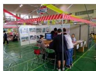
写真4 アーカイブ掲載資料