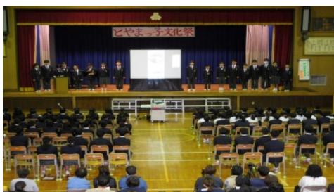
児童が防災学習の成果を発表（右）