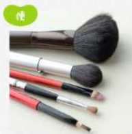
住宅用品・家具・工芸品