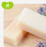
日用品・雑貨・その他