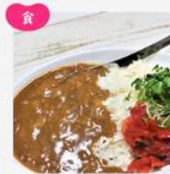
調味料・レトルト食品