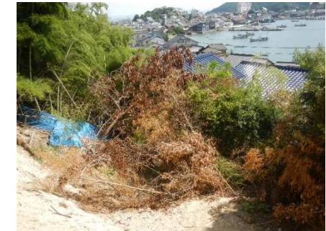
斜面崩壊・被災状況（H30年7月）