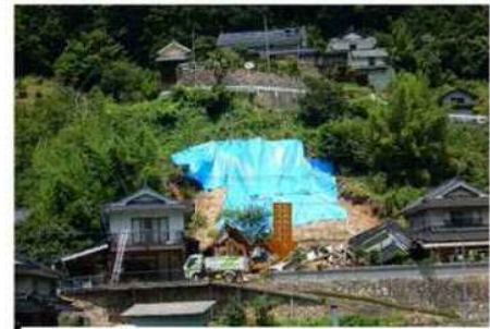
斜面崩壊・被災状況 (H30年7月)