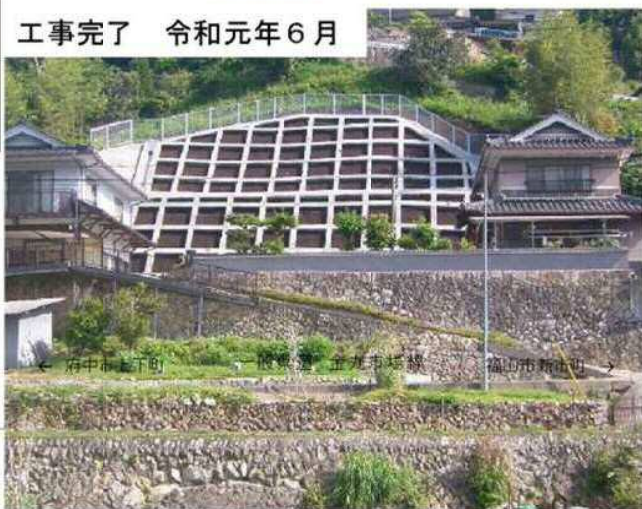
工事完了 令和元年6月